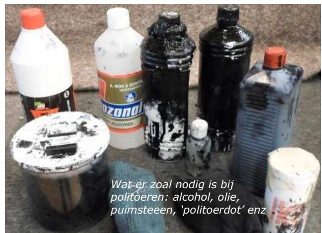
Wat er zoal nodig is bij politoeren: alcohol, olie, puimsteen, 'politoerdot' enz

Dan komt het 'afpolitoeren'. Dat beginnen we met een mengsel van politoer en methylalcohol en eindigen met louter alcohol en polish, totdat het meubel een heldere glans heeft.