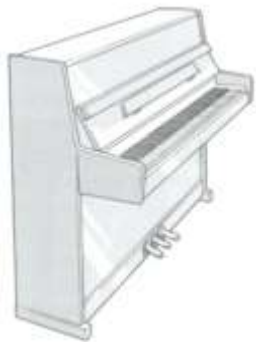
1.10 mtr. hoge piano