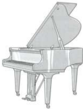
(Baby) vleugel 1.50 mtr.