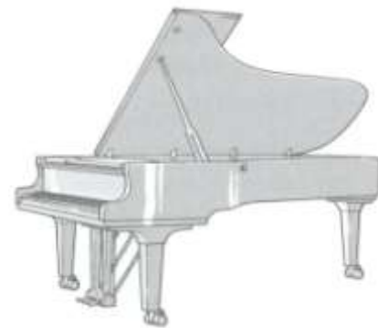
(Concert)vleugel 2.75 mtr.