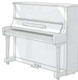
1.25 mtr. hoge piano