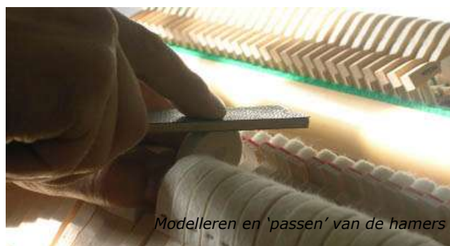
Modelleren en 'passen' van de hamers

Hoe beter van kwaliteit de piano is, des te preciezer kan het instrument worden geïntoneerd. Is het instrument van matige kwaliteit, dan verbetert de vakman dat niet door het te intoneren.